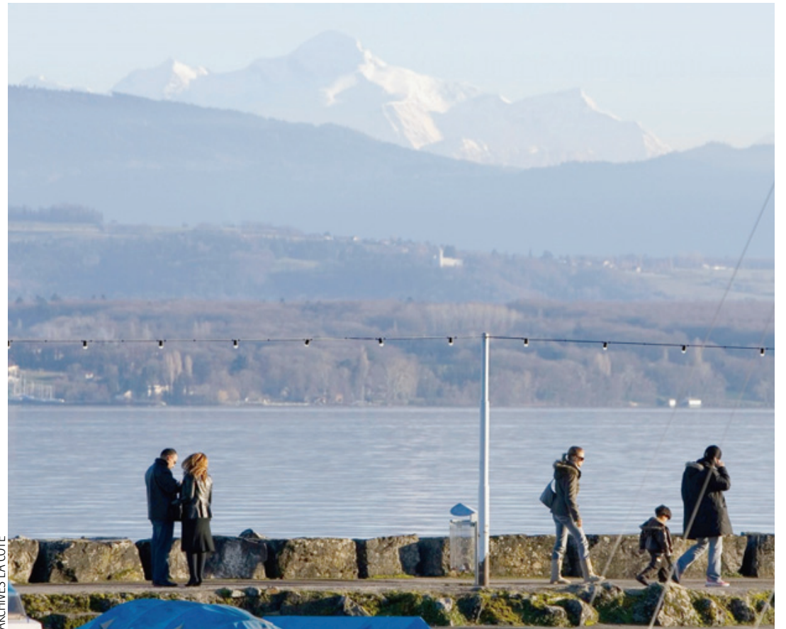
ARCHIVES LA CÔTE

Aussi mentionné le chemin public à créer depuis Rive-Est